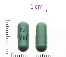
Capuchon: BJ Corps: F10